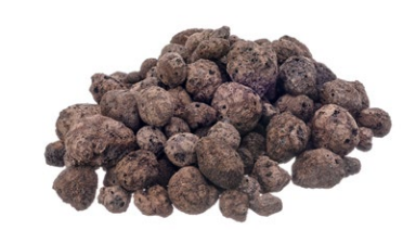
KERAMZYT 8/16 mm