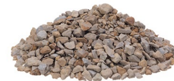
CHALCEDONIT 2/10 mm

Podłoże dobrej jakości powinno charakteryzować się odpowiednią przepuszczalnością przy jednoczesnej zdolności do zatrzymania wody i składników mineralnych. Naturalne materiały, które oferujemy, po zmieszaniu z ziemią lub wysypane wokół roślin, poprawiają jej właściwości fizyczne i chemiczne tworząc optymalne warunki do wzrostu i rozwoju roślin.