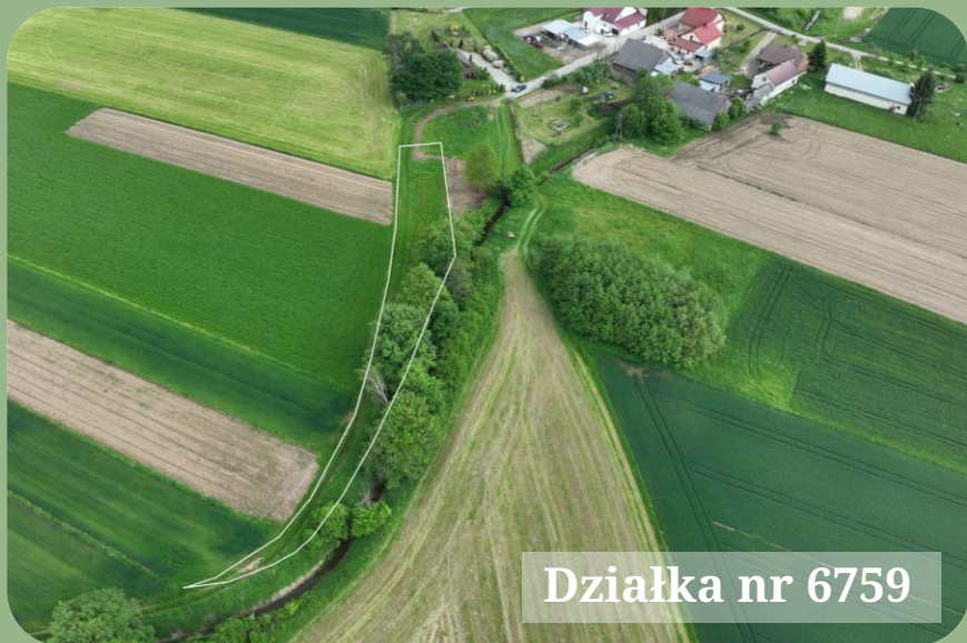
Działka nr 6759