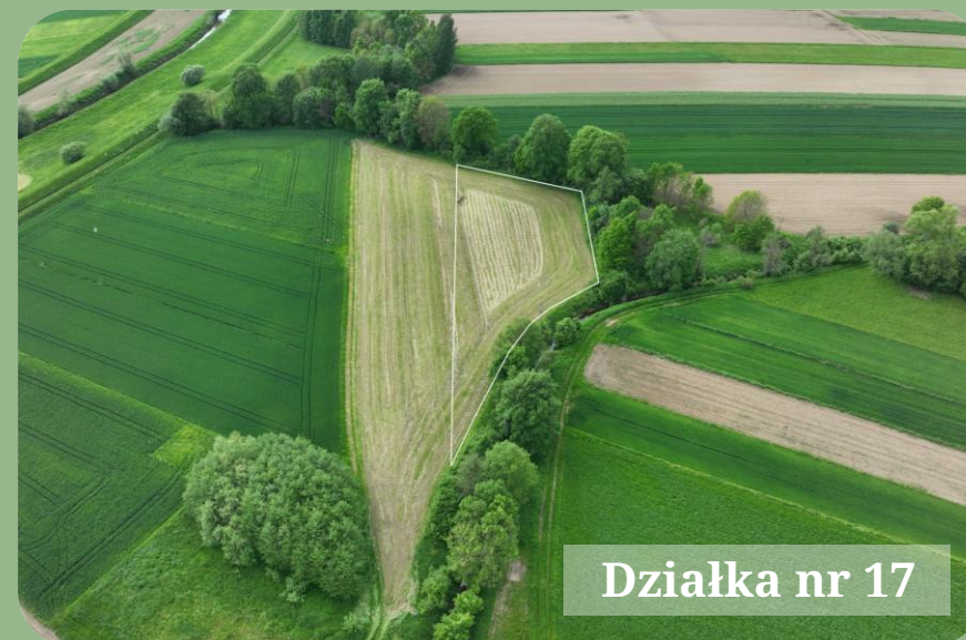
Działka nr 17

Działki przeznaczone do sprzedaży stanowią przedmiot łącznej transakcji. Oferty powinny uwzględniać obie działki.